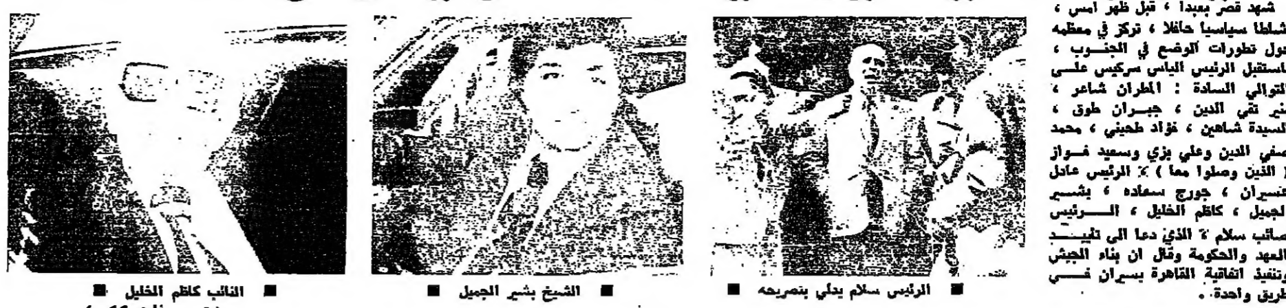
شهد قصر بعيدا، قبل ظهر امس، نشطا سياسيا خلافا، ترك في مقدمته حول تطورات الوضع في الجنوب، فاستقبل الرئيس ياسين سركيس على التوالي السادة: الخمران شاعر، منير شي الدين، جبران طوق، السيد شاهين، فؤاد طهيني، محمد صفي الدين وعلي بزي وسعيد فوزان (الذين وصلوا معاً) والرئيس عامل سريان، جورج سمادة، وياسين الجليل، كاتم الخليل، والسريسي صائب سلام، الذي دعا الى تنفيذ العهد والحكومة وقال ان بناء الجيش وتنفيذ اتفاقية القاهرة يسيران في طريق واحدة.